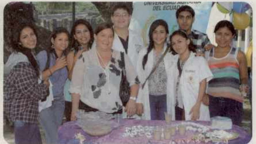
DULCES Y BOCADITOS ELABORADOS CON LECHE