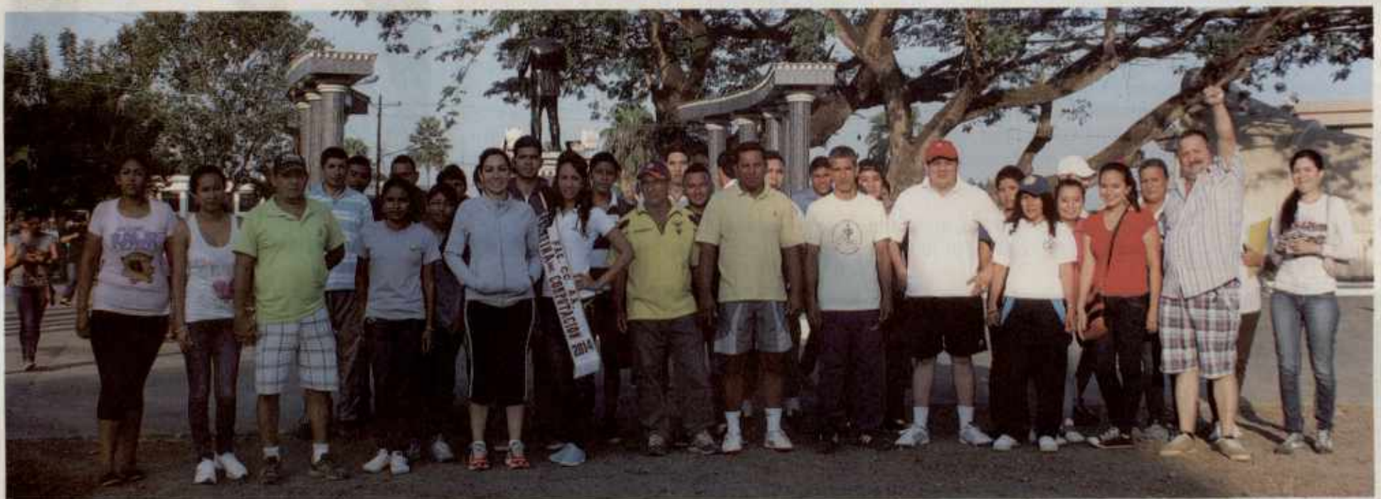
Poniendo el ejemplo, nuestra rectora llegó muy temprano la mañana del sábado 12 de julio anterior, a la Ciudad Universitaria Milagro, para iniciar la caminata que recorrió los predios de la CUM, acompañada de estudiantes, docentes y empleados de la UAE.