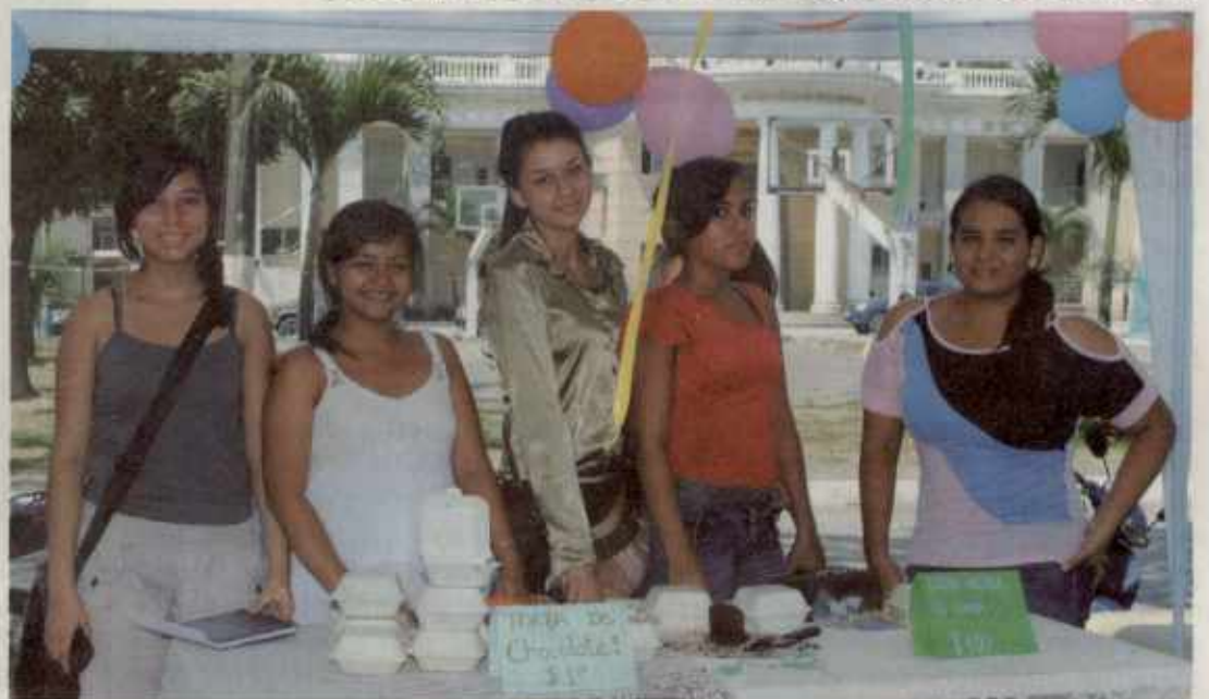
TORTA DE CHOCOLATE Y DE LIMÓN