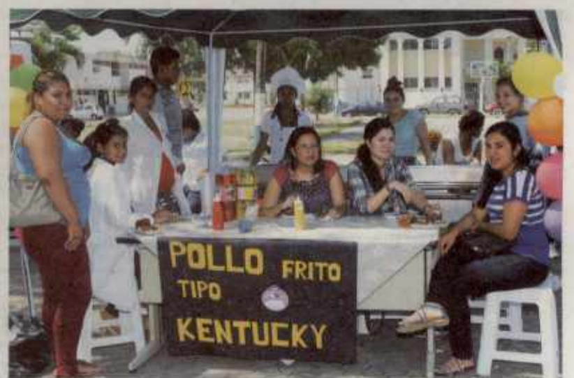
EL ORIGINAL POLLO FRITO KENTUCKY