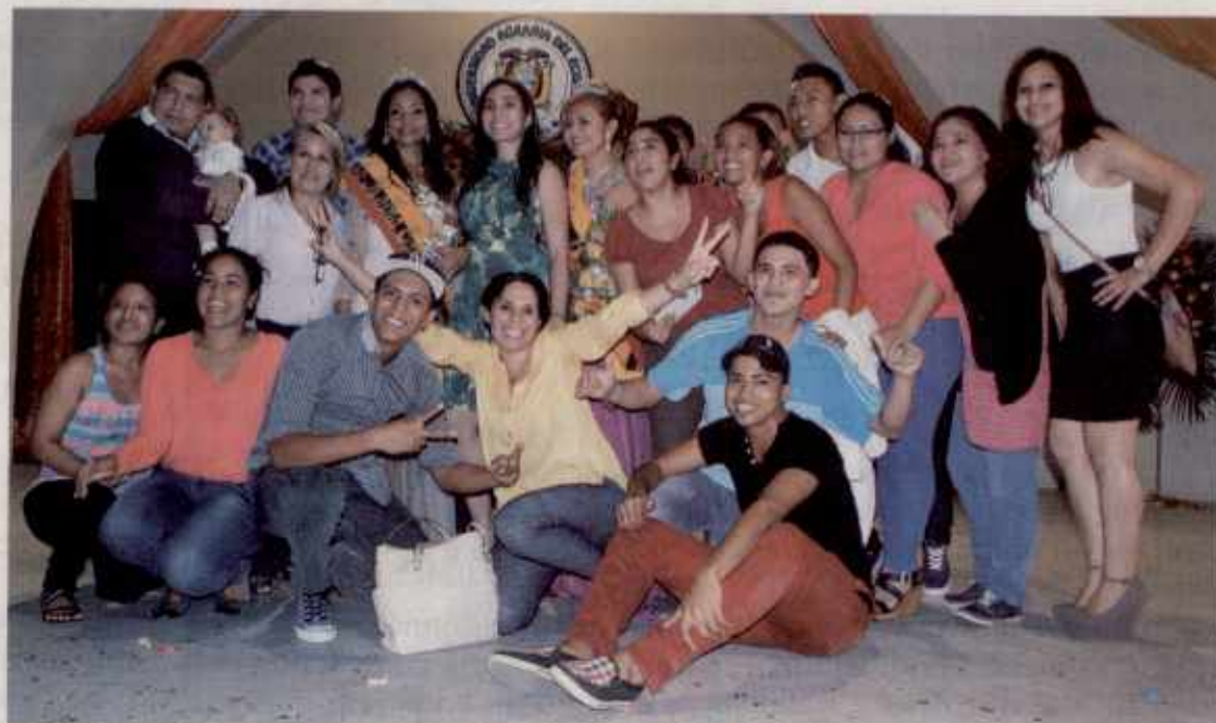
La Facultad de Economía Agrícola acaparó con los premios del reinado de la UAE. La numerosa barra se unió al festejo.