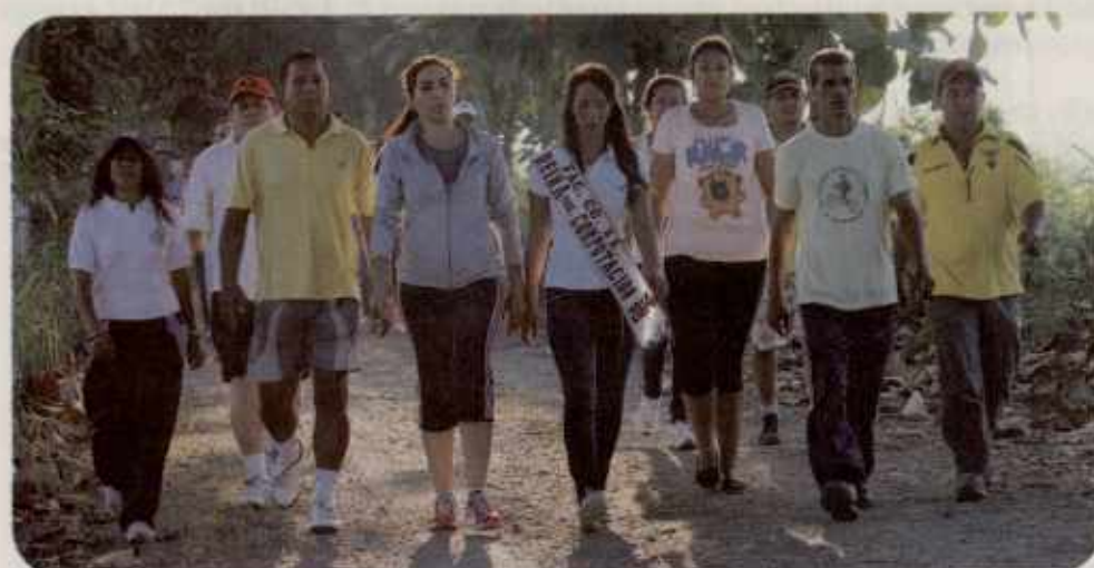
Cerca de 8 kilómetros recorrieron los participantes de la caminata agraria, encabezados por nuestra rectora de principio a fin.